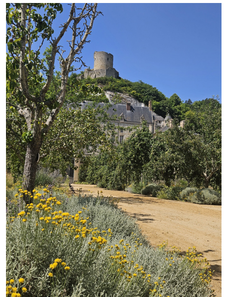
Allée Potager-fruitier