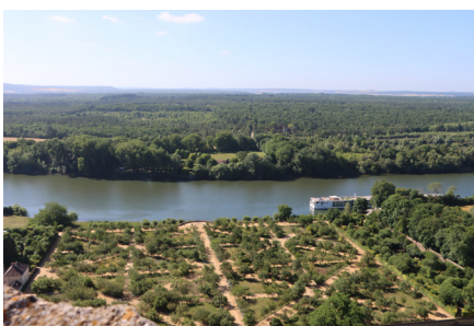
Vue Potager-fruitier depuis donjon