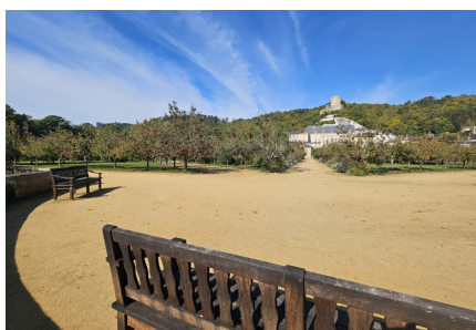
Belvédère Potager-fruitier