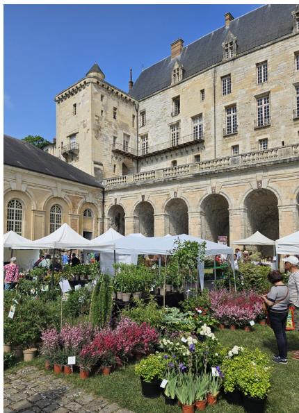
Pépiniéristes, fête des plantes 2025