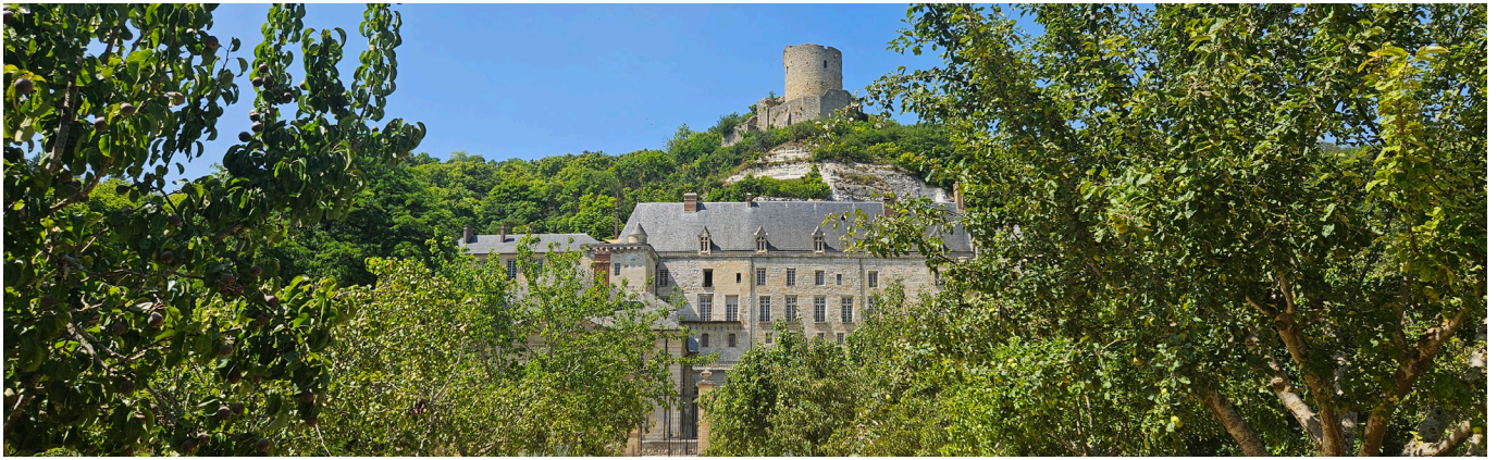
Vue depuis Potager-fruitier