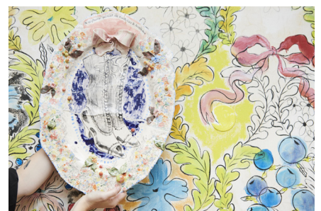
Céramique & peinture murale, Drawing Factory, 2021 ©Winsor & Newton