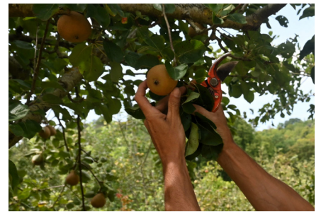
Récolte fruits Potager-fruitier