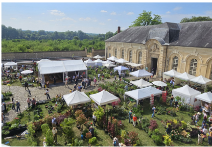
Vue générale fête des plantes 2025