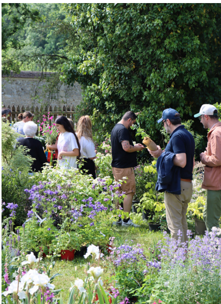
Visiteurs se baladant, fête des plantes 2025