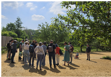
Visite Potager-fruitier, fête des plantes 2025